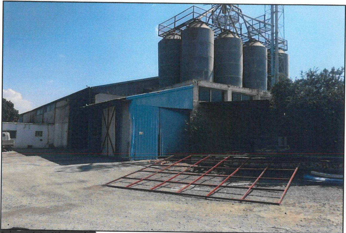
Κίνητο (α) - Νότιο Κτίριο